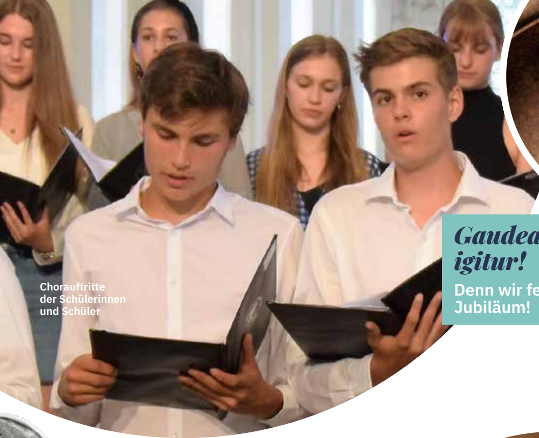
Chorauftritte der Schülerinnen und Schüler