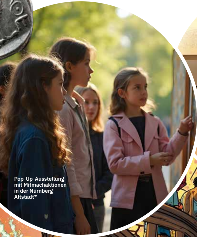
Pop-Up-Ausstellung mit Mitmachaktionen in der Nürnberg Altstadt*