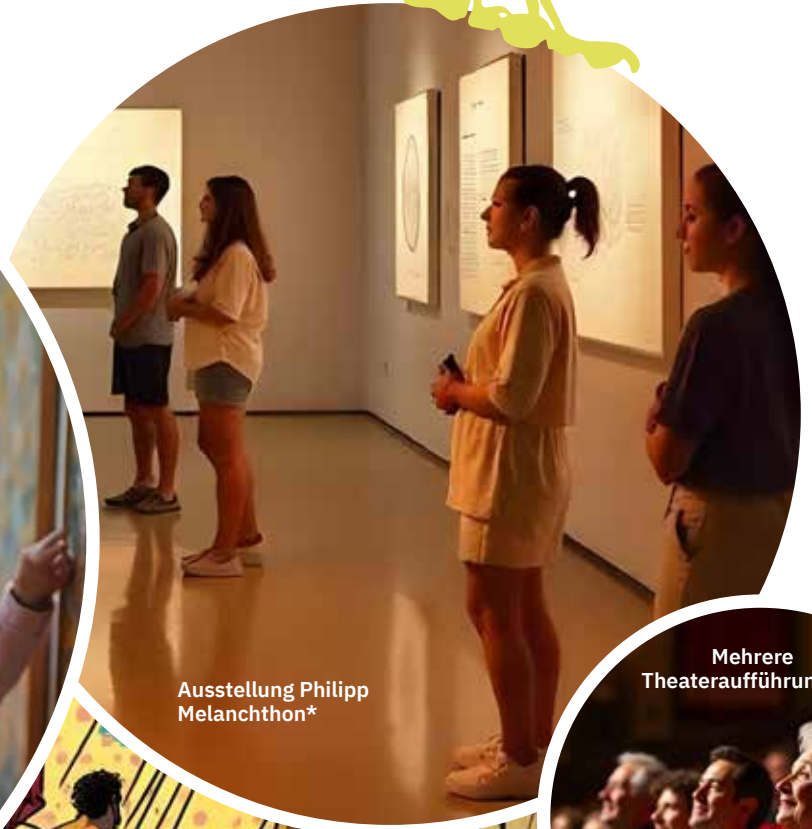
Ausstellung Philipp Melanchthon*